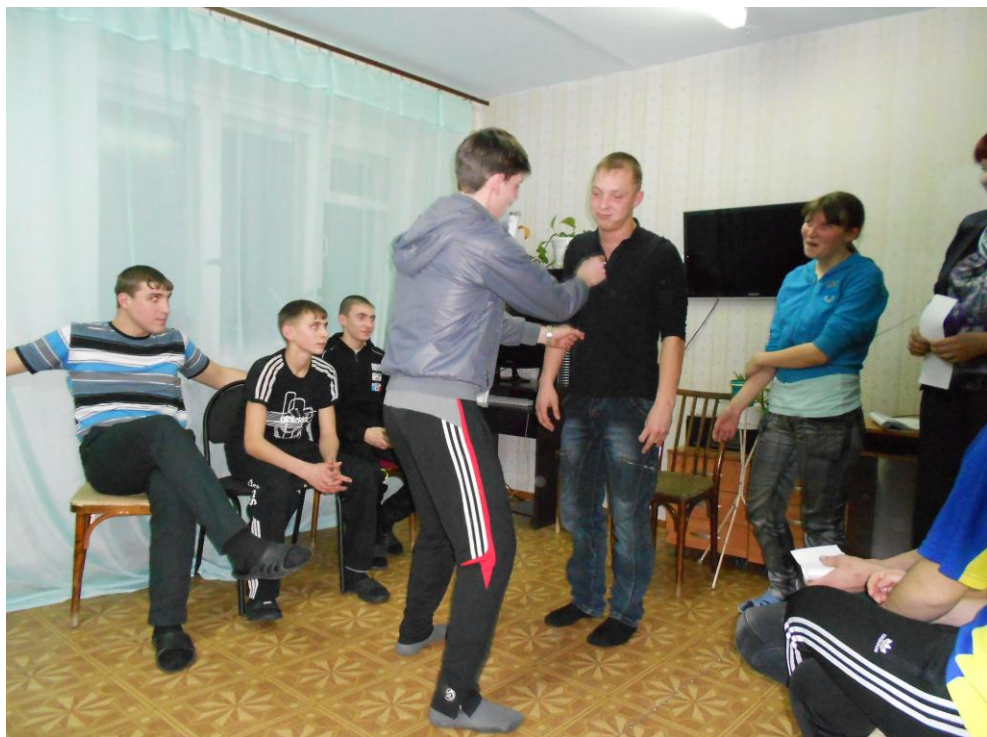
Занятия в спортивном зале