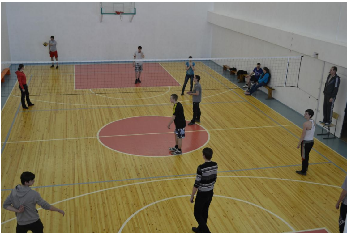
Занятия в тренажерном зале