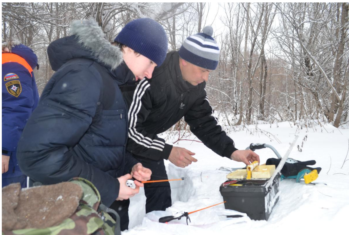
Сплав по реке Обь