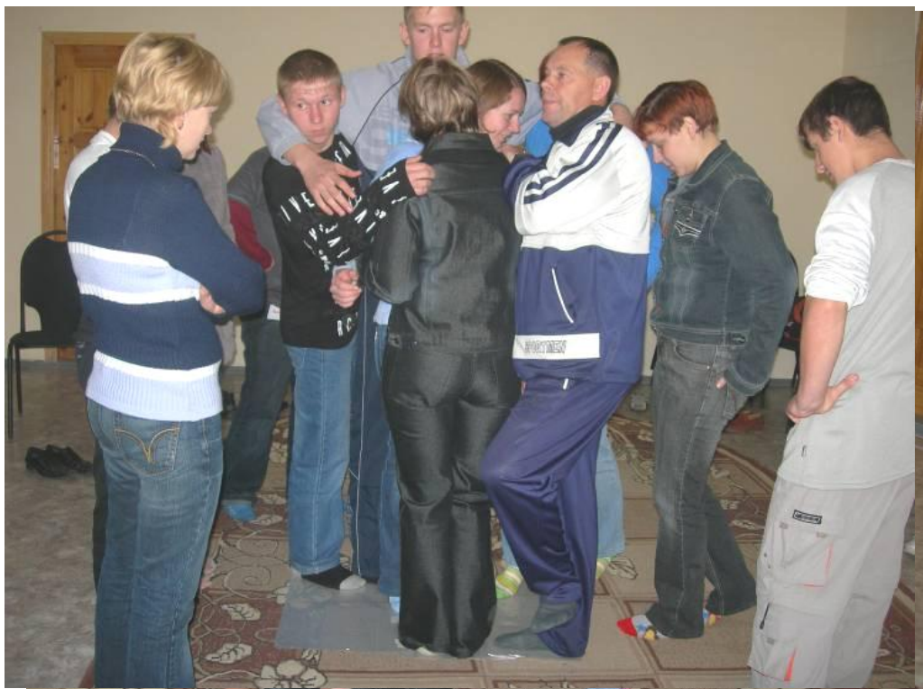
Приложение 2 Тренинг «Стрессоустойчивость»