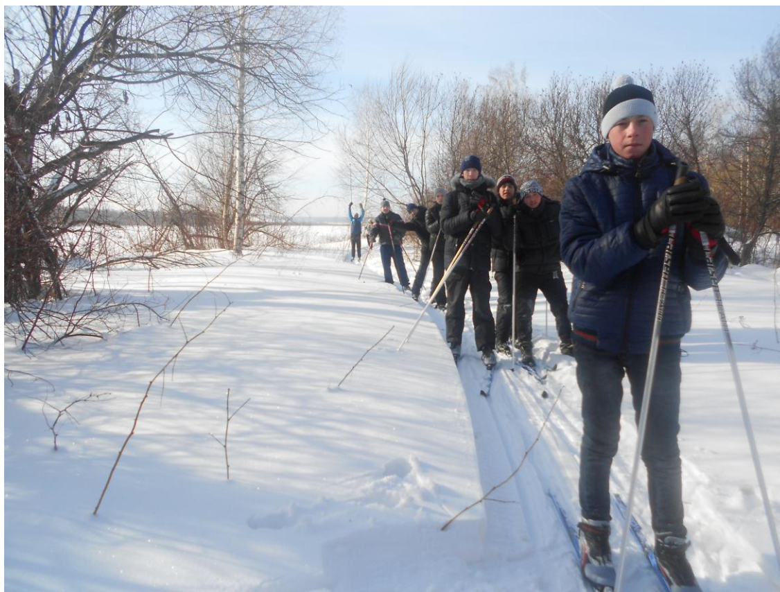
Эколого-краеведческая экспедиция на озеро Кожимар