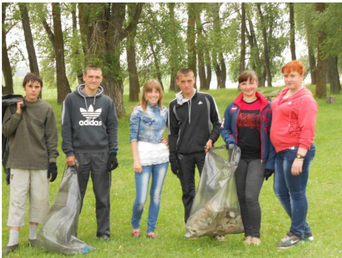
Экспедиция в д.Ергай